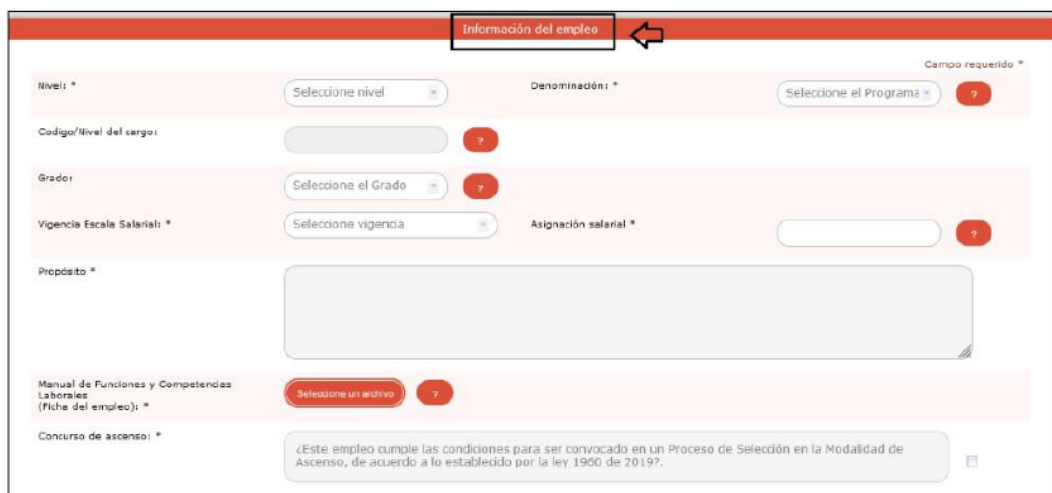
Ilustración 1. Formulario Información del Empleo

Asimismo, se podrá indicar si el empleo cuenta con las condiciones para ser convocado en un proceso de selección en la modalidad de ascenso.